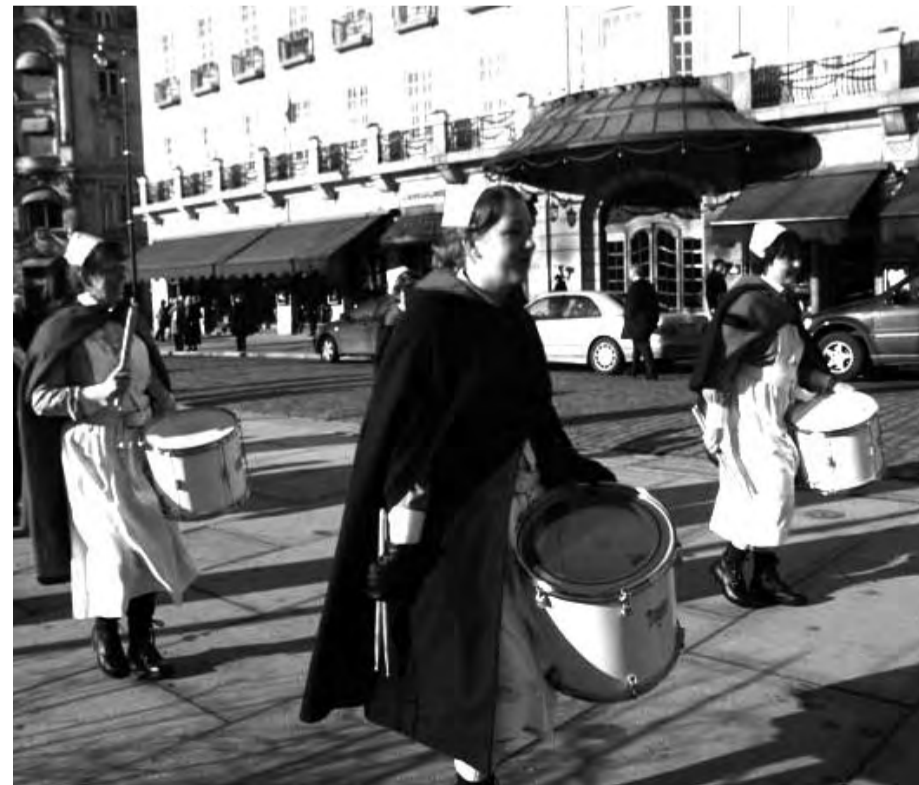
Sjukepleiere er utmerkede helsearbeidere. De er også utmerkede demonstranter for folketrygd, for AFP og mot sosial dumping! Her med trommer som varsel.

– I vår tid er klimakatastrofen menneskehetens største trussel. Det er miljøvennlig å bruke mer av landets arbeidskraft til å gi andre mennesker et bedre liv. Vi drukner i ting. La menneskenes behov – ikke kapitalens behov – styre bruken av arbeidskraften vår, avslutter Dahle.