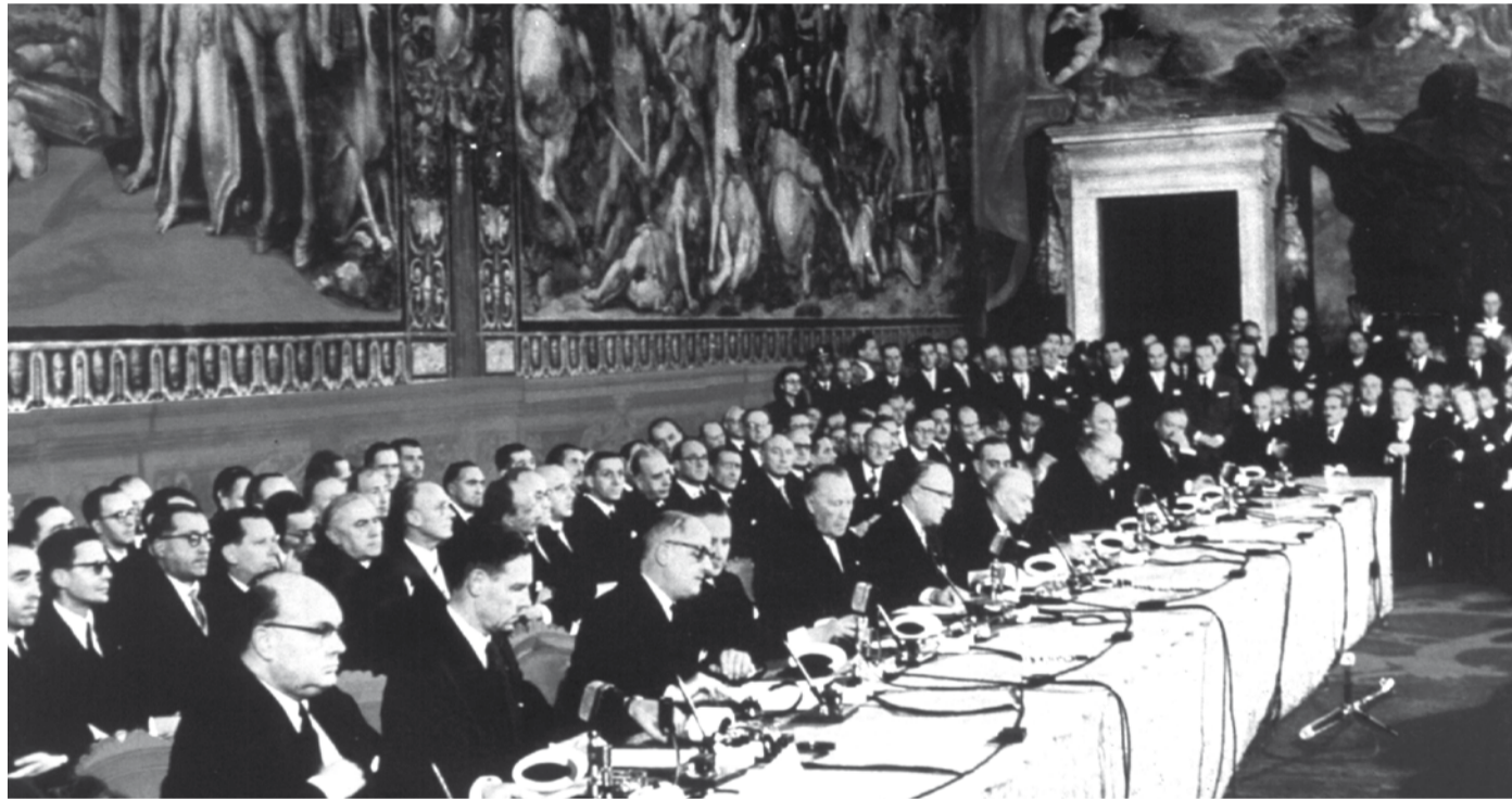
Fra underskrivingen av Romatraktaten

Femti år etter Romatraktaten halter Den europeiske unionen videre. De fire frihetene bygger på kravene fra stor kapitalen, ikke på vanlige folks behov. Markedsliberalismen som er fastlagt i Roma-traktaten gjør livet surt for alminnelige EU-borgere. Den er en ulykke for arbeiderklassen. I dag er det en voksende EU-motstand i selve EU. 18. november 2006 gikk 10 000 demonstranter (blant dem 400 ordførere) i Paris under parolen: «Brudd med den europeiske unionen». Og NRK har ikke fortalt deg om det. Å kreve nasjonal styring tilbake er i dag en voksende strømning i Frankrike, hvor utmelding av EU ikke lenger er et tabubelagt tema blant folk.