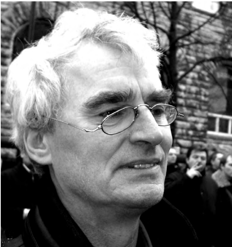
Artikkelforfatteren er leder for LO i Trondheim.