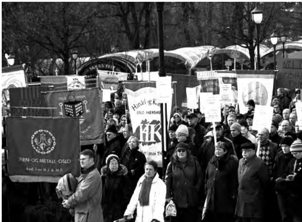
Fra en av mange demonstrasjoner for AFP

Hvis Frp reiser riktige krav, er det selvsagt helt utmerket. Men ingen må tro at partiet er noen alliert. Tvert imot: Frp er den mest innbitte motstanderen i den saken som nå er helt i spissen i pensjonskampen – forsvaret av AFP-ordningen. Frp har tatt mål av seg til å få knekt de offentlig ansattes pensjonsavtaler. Og Frps hovedsyn er å rive folketrygden i småbiter. Men de er lure taktikere – det skal ingen ta ifra dem!